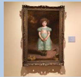
ジョン・エヴァリット・ミレイ作「あひるの子」