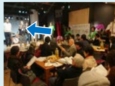
↑ 大勢の前で活動アピール中！

じつは、フジタは「好きっちゃ北九州」という団体に所属しています♪ その名の通り、北九州が好きっちゃね！！って言える人なら、誰でも参加OK。具体的な活動は、地元の子供たちに住むまちの素晴らしいところや魅力を感じる点を見つけてもらい、自ら他区の子供たちに自慢しちゃう、というもの。「シビックプライド」なるものを推進する北九州市にあって、けっこう注目されて来るであろう…予感♪ おらがまちが好きな人。なかま、集ってまーす♪