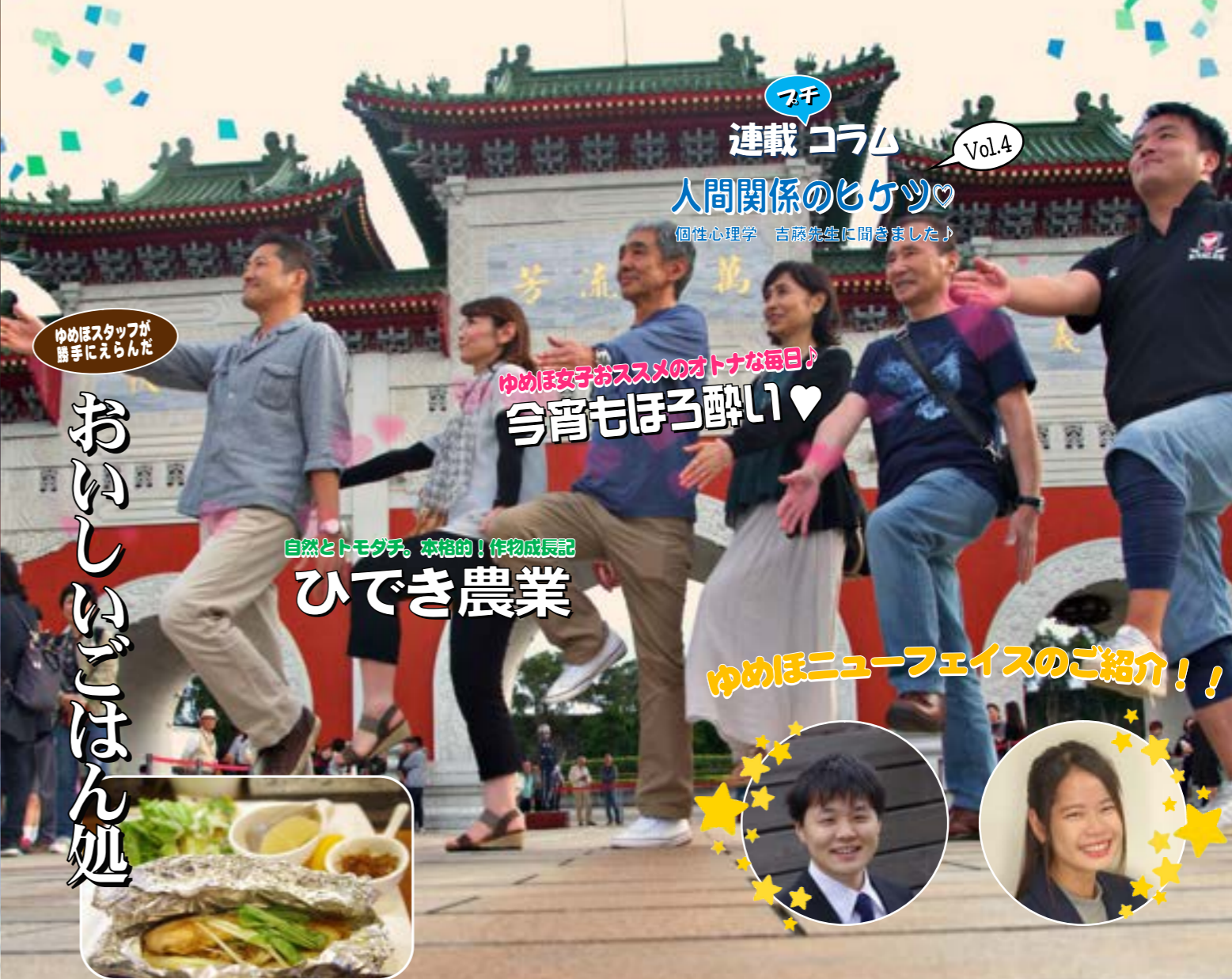
ゆめほスタッフが勝手にえらんだ